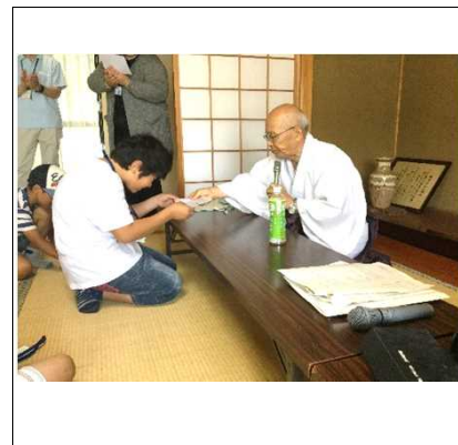
③宮司さんより認定証授与