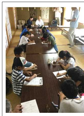
②天満神社検定に挑戦